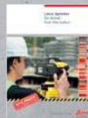
Leica Sprinter Nivel digital de un solo botón