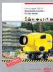
Leica Jogger 20/24 Niveles automáticos – Hechos para el trabajo

Para más información acerca de nuestro programa TQM consulte a su agente local de Leica Geosystems.