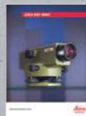
Leica NA2/NAK2 El nivel clásico de alta precisión