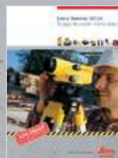
Leica Runner 20/24 Niveles automáticos robustos y a un precio justo